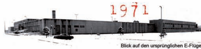
Blick auf den ursprünglichen E-Flügel