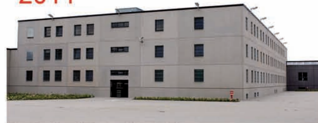
Blick auf den E- und G-Flügel vom Wirtschaftshof (neu) aus