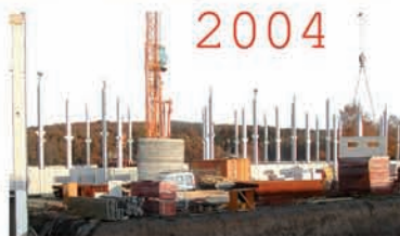
Hier entsteht der neue E- und G-Flügel

Die 2004 begonnenen An- und Umbaumaßnahmen sind noch nicht abgeschlossen. Die Sanierung im Altbau wird fortgesetzt. Für 2012 ist der Umbau des Verwaltungs- und Besuchsbereichs geplant.