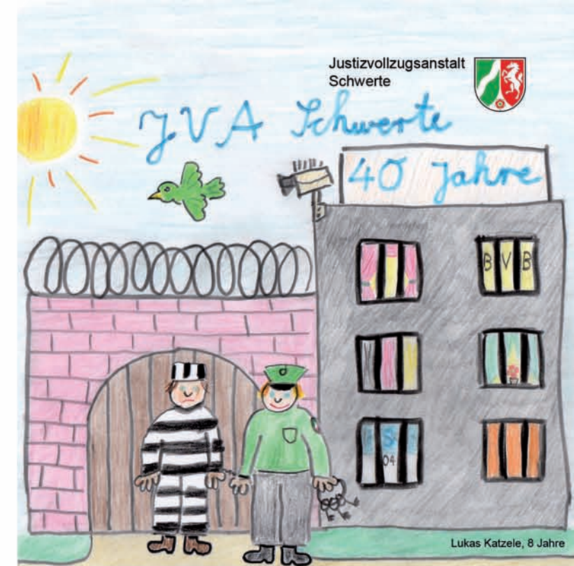
Lukas Katzele, 8 Jahre

„The Lost Souls“ - die verlorenen Seelen, ein Bandprojekt von Inhaftierten der JVA Schwerte. Ihr Leben unterscheidet sich fundamental von dem eines „Campino“, also klingen ihre Lieder auch anders. Wie sie klingen, können Sie um 10.30 Uhr und 14.00 Uhr an der Rundgangstation 24 erleben.